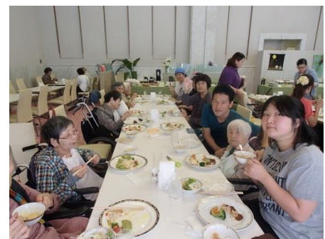
レストランで昼食