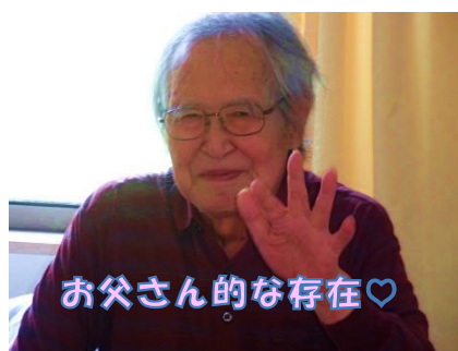
お父さんの的な存在♡