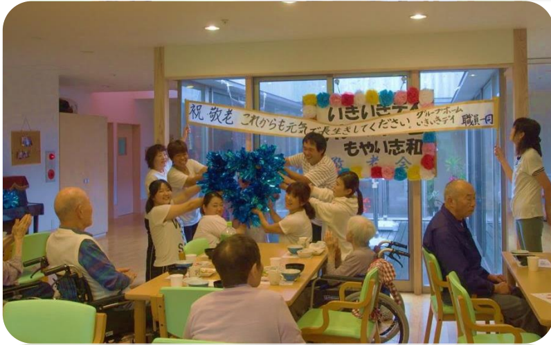
もやいチアダンス部による Shake it off ♪

9/24敬老会を開催し、職員によるダンスや手料理で皆様のご健康と長寿をお祝いしました。これからもお元気で長生きして下さい。