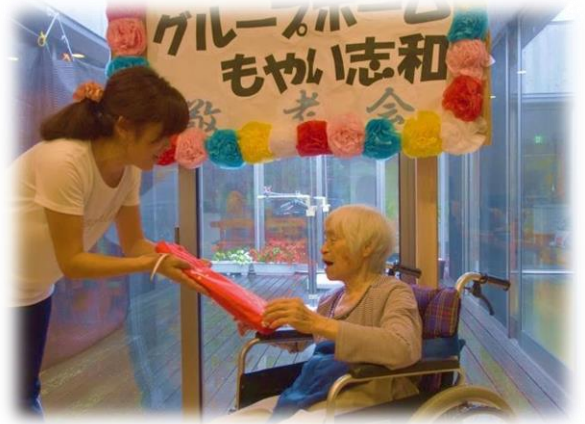
記念品の贈呈！！今年は長寿箸 をプレゼントしました。