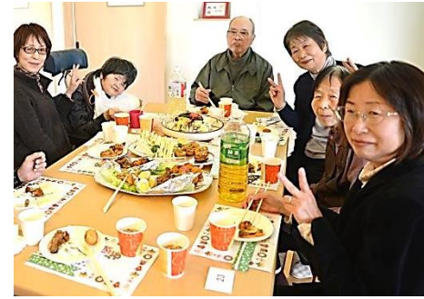
ご家族様と一緒に☆