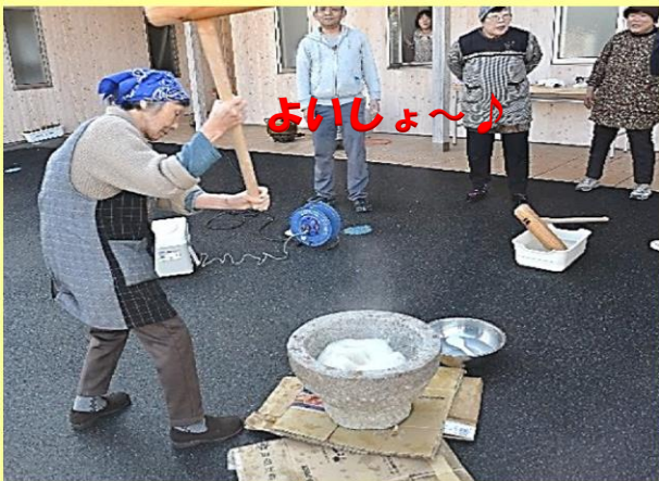
石臼と杵で餅つき！