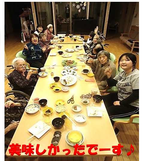
美味しかったでーす♪