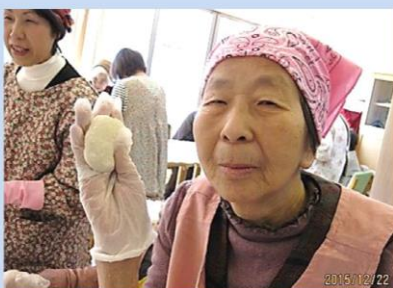
上手に丸めました♪