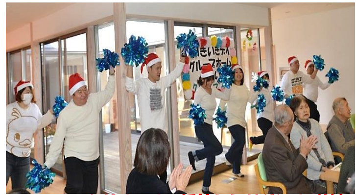
クリスマスの妖精たちがダンス(笑)