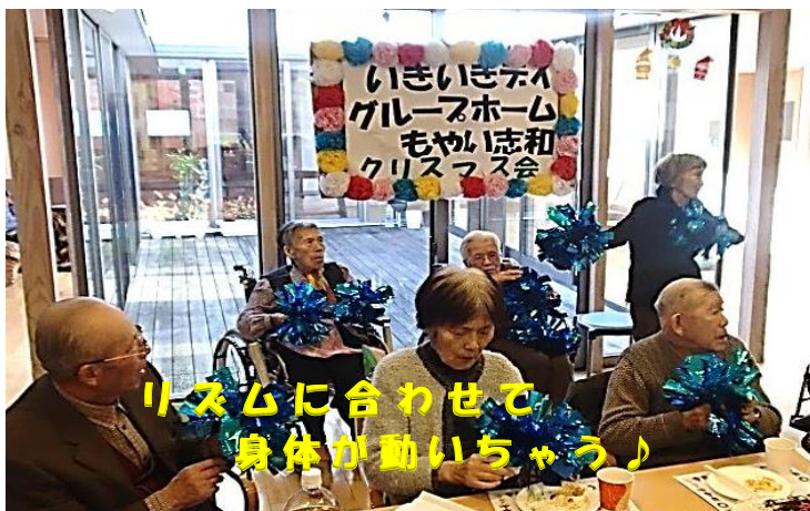
リズムに合わせて 身体が動いちゃう♪