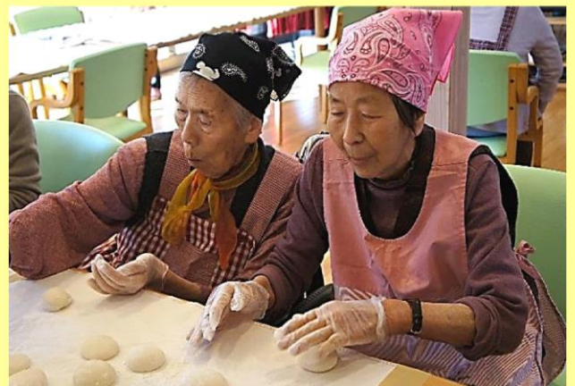
真剣に丸めますよ！