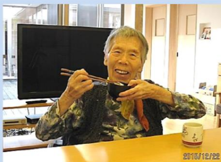
つきたては美味しいね☆