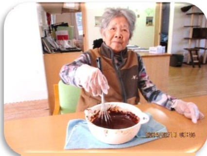
愛をこめて混ぜ混ぜ ♪