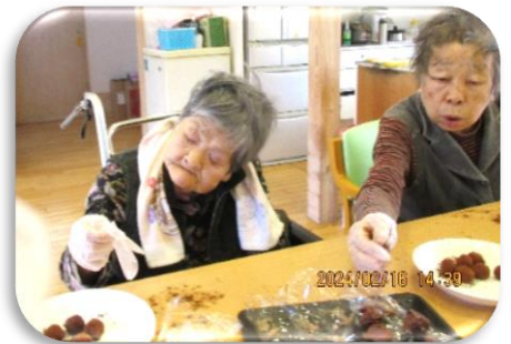
トリュフ！出来上がり(*^^*)

チョコレートのパウンドケーキとトリュフを作りました。甘さ控えめで、大人のチョコの完成です！