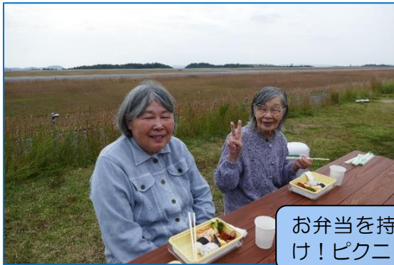
お弁当を持参してのお出かけ！ピクニック気分です♪