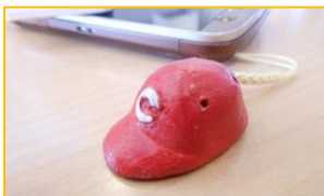
カープの帽子をモチーフにしたオカリナです。