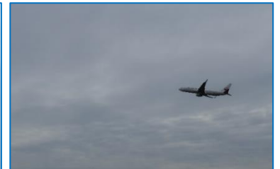
目の前を通りすぎて、雄大に離陸する飛行機を見て、歓声をあげていました。