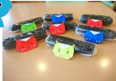
たくさんの巻き寿司を作ることができました。