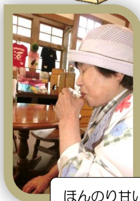
ほんのり甘いお酒を試飲しました。