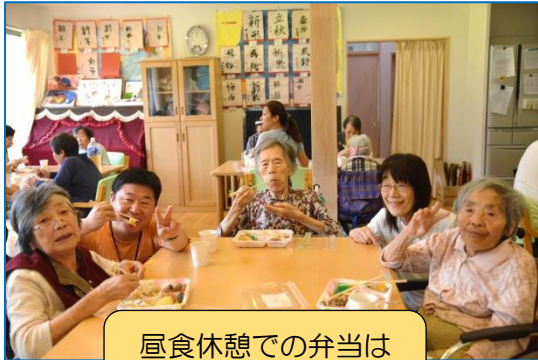
昼食休憩での弁当は 職員の手作り