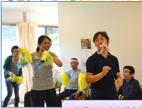
職員による応援合戦