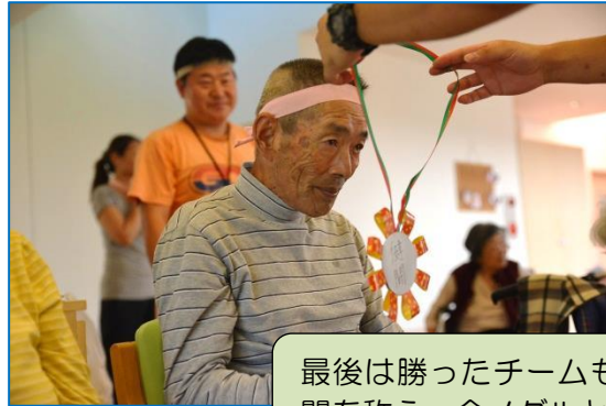
最後は勝ったチームも負けたチームも健闘を称え、金メダルと銀メダルの授与