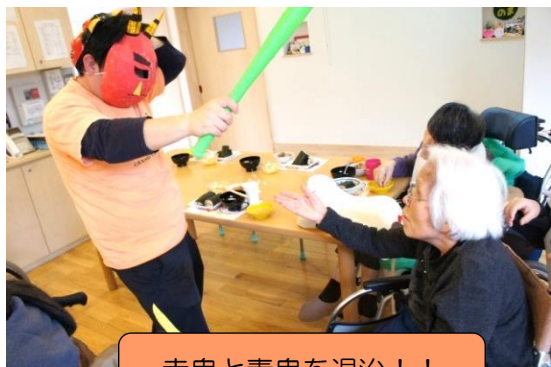
赤鬼と青鬼を退治！！