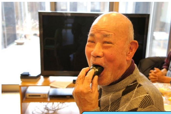
今年の恵方は西南西です。