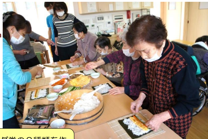
田舎巻とサラダ巻の2種類を作りました。