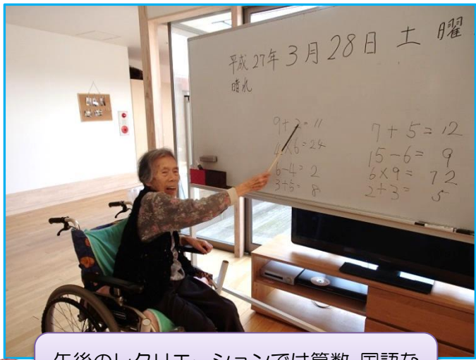
午後のレクリエーションでは算数、国語など頭の体操を行っています