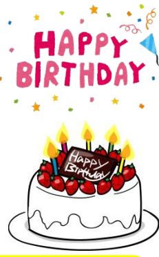
誕生日会を行いました。メッセージカードやケーキを前に記念撮影をし、おいしいケーキを召し上がりながらお祝いをしました。