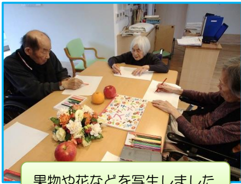
果物や花などを写生しました