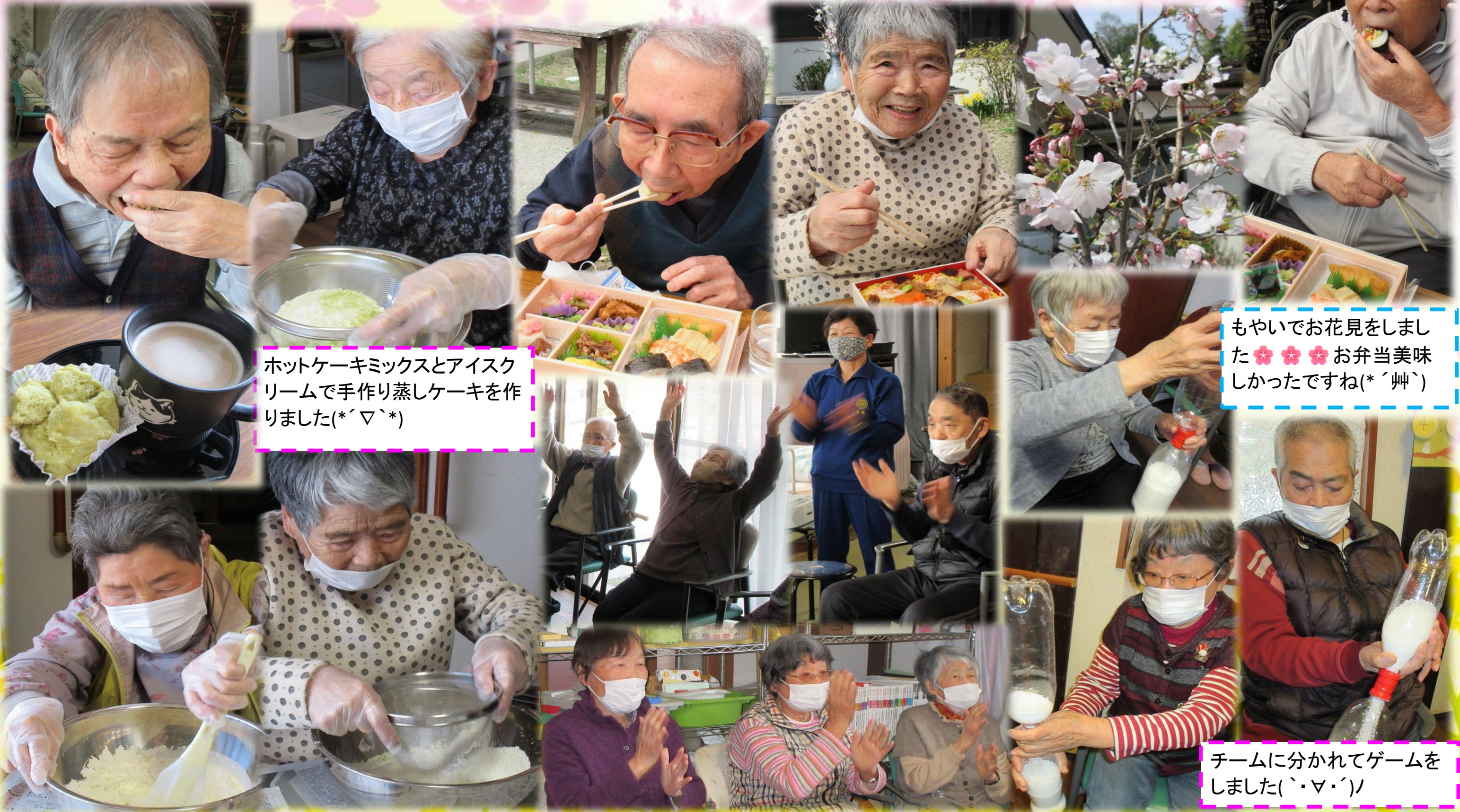
ホットケーキミックスとアイスクリームで手作り蒸しケーキを作りました(*´▽`*)