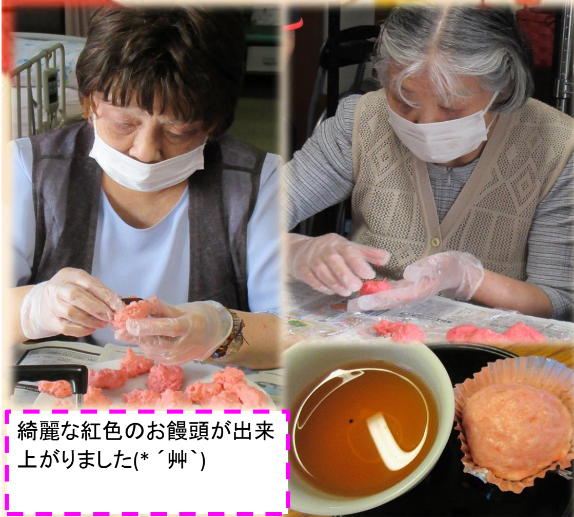
綺麗な紅色のお饅頭が出来上がりました(*´艸`)