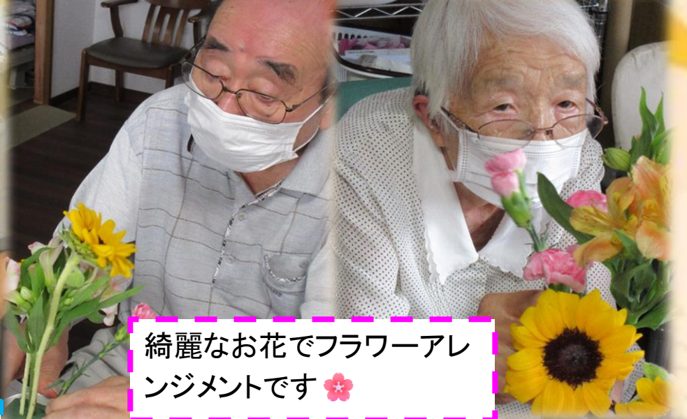
綺麗なお花でフラワーアレンジメントです🌸