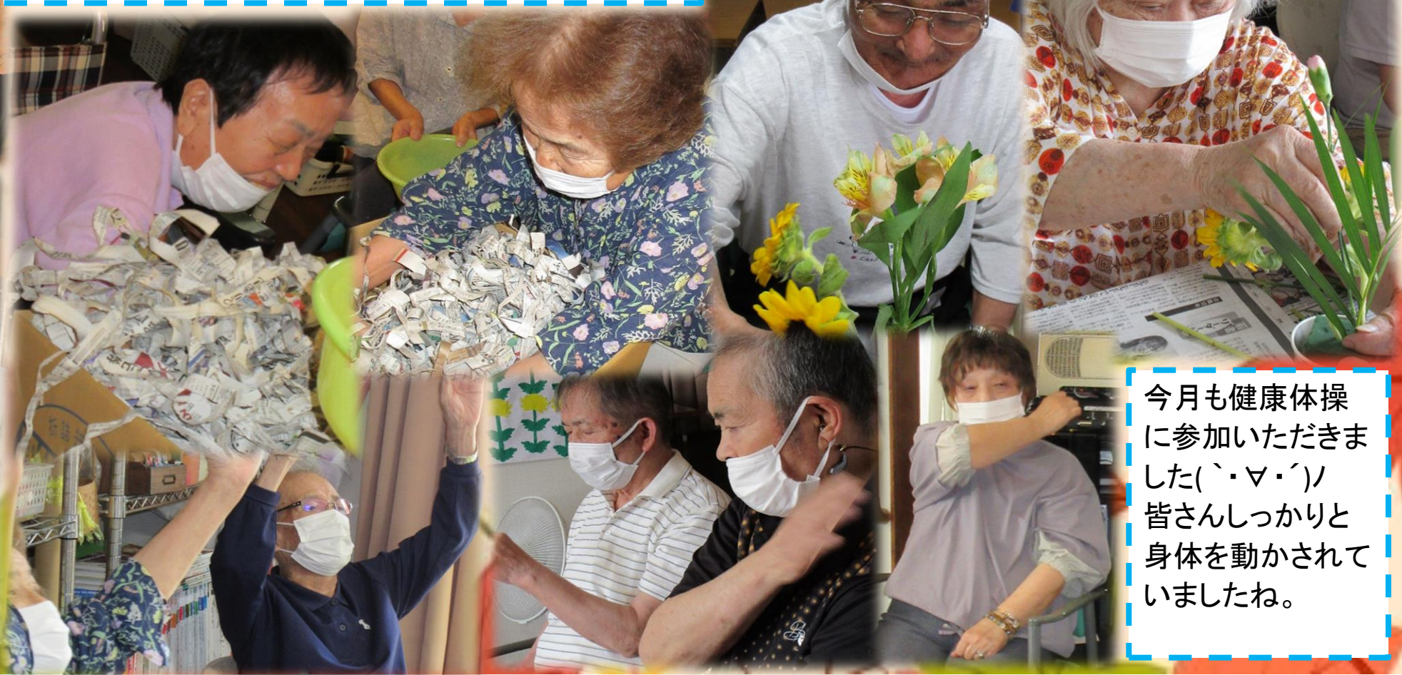
今月も健康体操に参加いただきました(´・▽・´)ノ 皆さんしっかりと身体を動かされていましたね。